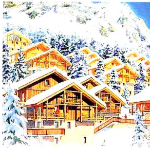
Des vacances au grand air

Rens. : 04 42 61 20 49 ; www.hameau-rennes.com