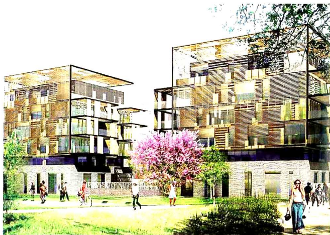
De vastes espaces à vivre