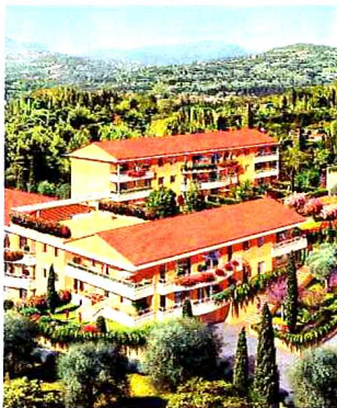
Un cadre exceptionnel

Cité des parfums, Grasse est une ville au charme typiquement méditerranéen. C'est dans un quartier résidentiel de la ville, tout près du golf de Saint-Donat, des écoles et des commerces, que Sagec propose Les Jardins de Toscane. Situé au sommet d'une colline, le programme se compose de sept bâtiments de deux étages, et jouit d'un cadre paysager exceptionnel.