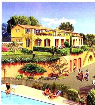
À proximité du centre-ville et du port

Entre le massif des Maures et une plage de sable fin de plus de 3 km, Cavalaire-sur-Mer, situé sur la presqu'île de Saint-Tropez, s'inscrit dans un site exceptionnel. C'est sur